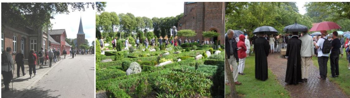
Billeder fra vandringerne Peregrinus 2009 til Løgumkloster

Medlemmerne vil få indkaldelse til den årlige generalforsamling i april måned og ligeledes vil støtteforeningen forsøge at lave nyhedsbreve via E-mail.