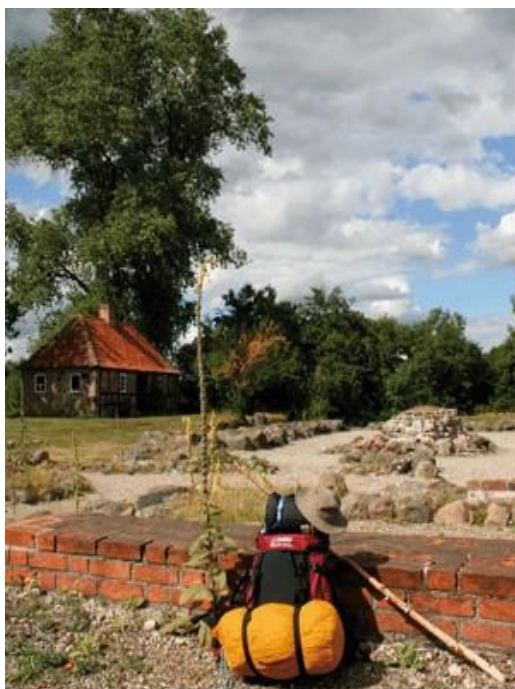
Den Danske Klosterrute

Den Danske Klosterrute er i alt ca. 1800 km lang og går fra Helsingør på Sjælland til Frederikshavn i Nordjylland. Ruten forbinder op mod 40 steder, hvor der blev bygget klostre i middelalderen. Hovedvægten i bøgerne er lagt på kirkebesøg og kulturseværdigheder.